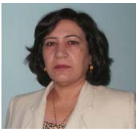
ÊŞKENCE LI RÊBER APO TÊ KIRIN