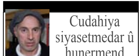
Cudahiya siyasetmedar û hunermend

tendurûstiya me jî başe. Em her roj dibînin gelek mirov ji ber xwarinên amade nexweş dikevin. Ji bo wê divê em civakê jî bo wê yekê hişyar bikin, divê civak bizane ku xwarinên amade ne baş in û bala xwe bidin ser xwarinên Kurdewarî û xwezayî." ROJNEWS