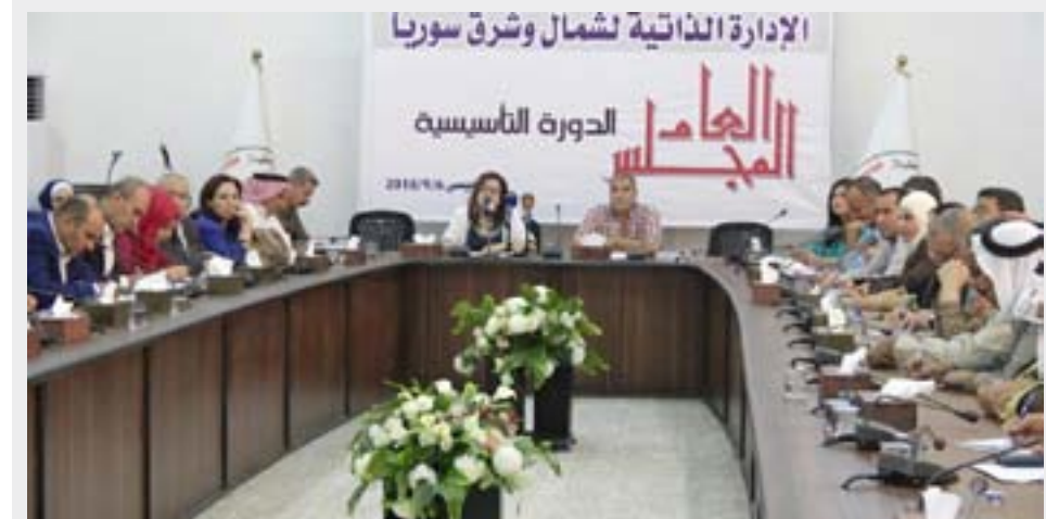
Meclisa Rêveber a Rêveberiya Xweser a Bakur û Rojhilatê Sûriyê Dr. Berhem Salih ku bû serokkomarê nû yê Iraqê, pîroz kir

Iraqê de Dr. Berhem Salih bû serokkomarê Iraqê yê nû. Der barê mijarê de Meclisa Rêveber a Rêveberiya Xweser a Bakur û Rojhilatê Sûriyê peyamek weşand. Di peyamê de wiha hat gotin: "Bi navê Meclisa Rêveber a Rêveberiya Xweser a Bakur û Rojhilatê Sûriyê em gelê Iraqê li ser hilbijartina serokkomar Dr. Berhem Salih pîroz dikin. Di demekê de ku pêwîstiya Iraqê bi kesayetên ku dikarin birînen Iraqiyên derman bikin û rewşa belavbûnê bi dawî bikin, heye. Her wiha Iraqê hevgirtî bi hemû pêkhatiyên wê ava bikin. Em bawer in ku Dr. Berhem Salih wê bibe kesayeta rast a van hêviyan û bi vê minasebetê em ji wî û gelê Iraqê re serkeftinê dixwazin."