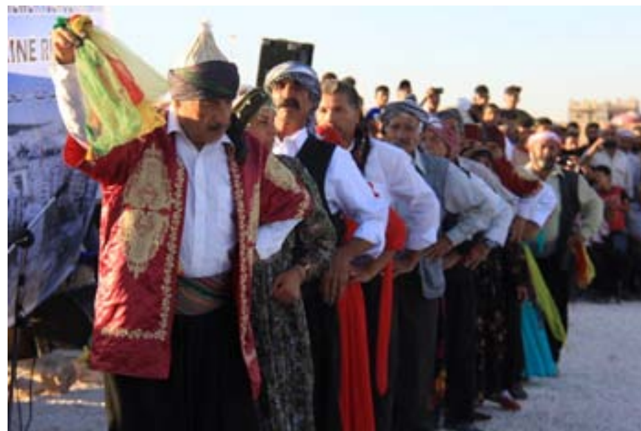
Rêveberê Tevgera Çand û Hunerê ya Efrînê Niyazî Seydo axivî û

Çalakîyên roja yekem a kampanyaya hunerî ku bi dirûşmeya "Ji bo rizgarkirina Efrînê bi piransîbên netewa demokratîk têkoşîyan" li Kampa Berxwedan tene organîzekirin, dest pê kirin. Kampanya bi armanca piştgiriya Pêngava Rizgarkirina Efrînê ji aliyê Tevgera Çand û Hunerê ve hat birêxistin kirin. Kampanya bi meşekê li Kampa Berxwedan hate ragihandin û bi çalakîyên hunerî dest pê kir. Di çalakîyê de, nûnerên Rêveberîya Xweserîya Demokratîk, şênî rêveberên kampa Berxwedan û Endamên Tevgera Çand û Hunerê amade bûn.