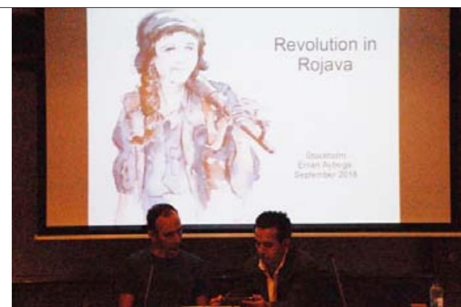
dema ku em lîdikolin em dibînin ku gelek jinên heja ku di warê wêjeyê de xwedî berhemên bi qîmet in, hene. Lê kes qala wan nake. Ji ber ku her dem keda wan hatiyê binaxkirin. Armanca me yek jê ew e ku jin di qada