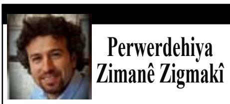
Perwerdehiya Zimanê Zigmakî

Dengbêjê Gazin ji bo ku kelepurê kurdan nede jibîrkirin, ode-yêke mala xwe ji motîfên çanda kurdî xemilandiye.