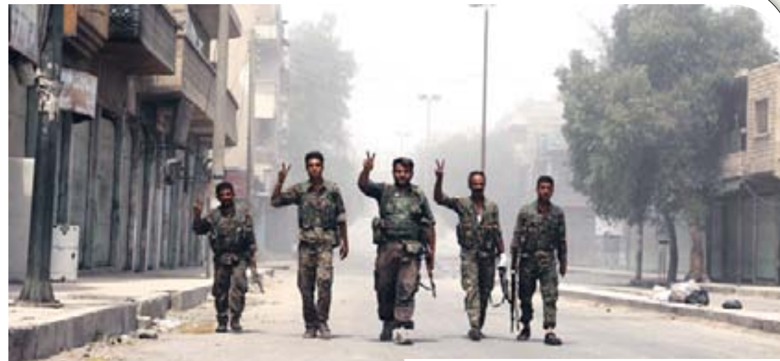
Cerablûsê ve vekin.

Ji bo parastina jiyana sivîlan şervanên Meclîsa Leşkerî ya Minbicê û Hêzên Sûriya Demokratîk (QSD) nexwestin hemleyê leşkerî li vê taxê pêk bînin. Têgerekê leşkerî dibe ku jiyana sivîlan bixe xetereyê mezin. Ji ber vê yekê şervan neçar man daxwaza çeteyan pêk bînin û rê ji wan re ber bi