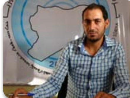
Nûnerê Partiya Nûjen û Demokratîk li Sûriyê ya Bu-

roya navçeya Til Hemîsê Îd El-Hîsên got: "Tirkiyê li gorî berjewendiyên xwe tevdiqere, li gelek deveran opozisyon firot." Nûnerê Partiya Nûjen û Demokratîk li Sûriyê ya Buroya navçeya Til Hemîsê Îd El-Hîsên da zanin ku hikûmeta Tirkiyê bi zihniyeta Osmanî hewl dide serweriya xwe li ser herêmê ferz bike û nasnameya gelan ji holê