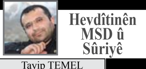
Hevdîtînên MSD û Sûriyê