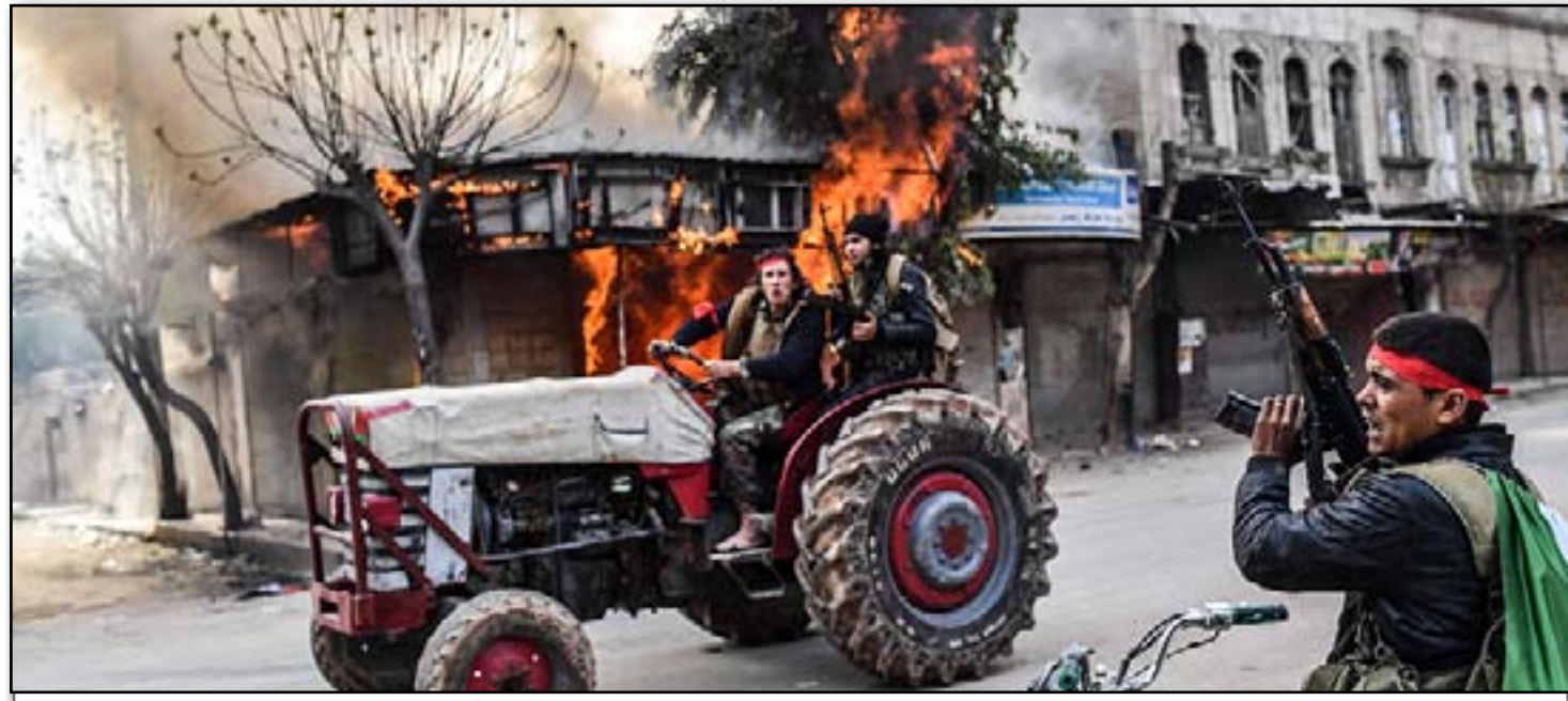
Zilm, hovîfî, weşet û hemû kiryarên dij mirovahî yên dagirkeriya dewleta Tirk li Efrînê li pêş çavên hemû cihanê berdewam dikin. Çete û leşkerên dagirker her roj davêjin ser malên welatiyan, wan direvînin û dest dafînin ser mal û milkên wan.

ser dewleta tirk de bi ser sûka gel de girtin, sûk dorpêç kirin. Hate gotin çeteyan 3 kes ji sûkê revandin û heta danê nivro hê jî ev dorpêça çeteyan didome. Li Efrînê ku ji hêla dewleta Tirk û çeteyên wan ve hatiye dagirkirin, her roj agahiyan li ser êşkence, tecawiz, talan û înfazê tên.