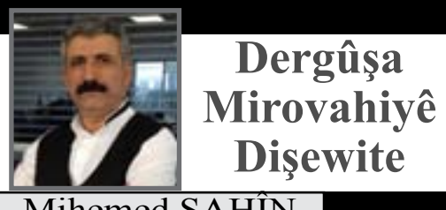
Dergûşa Mirovahiye Dişewite

hêza xwerêvebirin û parastinê û îşaret bi êrîşên dagirkeriyê yê dewleta Tirk ên li .Başûrê Kurdistanê kir NAV-DEM'ê diyar kir ku li dijî êrîşên dagirkerî û qirkirinê wê li gelemperîya Elmanyayê û Ewropayê roja 3'ê Tebaxê çalaki bîrîdar xistin û jî bo çalakiyan banga .tevlîbûnê kir