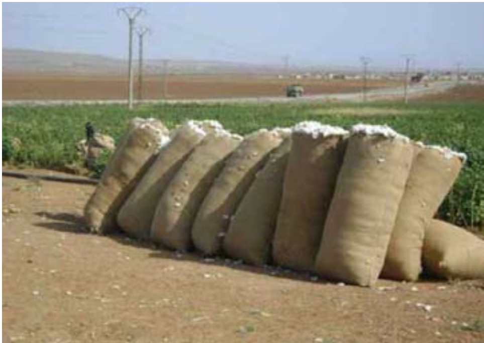
xistin. Di civînan de pîrsgirêkên ku li ber çandiniyê li herêmê dibin bend, hatin naskirin, jê; kêmbûna mazotê û tunebûna dermanên kûrmik û kêzikan.

Piştî bicihanina hinek daxwazên cotkaran, çandiniya sebze û pembo li Tirbesipiyê geş dibe. Cotkarên navçeyê di vê salê de 12 hezar û 251 donim zevî çandine. Cotkarên navçeya Tirbesipiyê, piştî ku Saziya Çandiniyê piştgiriya pêwîst daye, ji nû ve dest bi çandiniya sebze û pembo kir. Di salên dawîn de çandinî li navçeyê jî ber kêmbûna semad û dermanan paşde mabû. Vê salê qadên ku bi sebzeyên havînê hatine çandin 8 hezar û 290 donim û bi pembo 3 hezar û 961 donim e. Bi destpêka vê salê re Saziya Çandiniyê ya Tirbesipiyê jî bo naskirina sedemên paşdeçûna rêjeya çandiniya sebze û pembo li herêmê û jî bo pêşxistina wê, rêzecivîn ji cotkaran re li dar