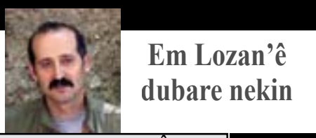
Em Lozan'ê dubare nekin