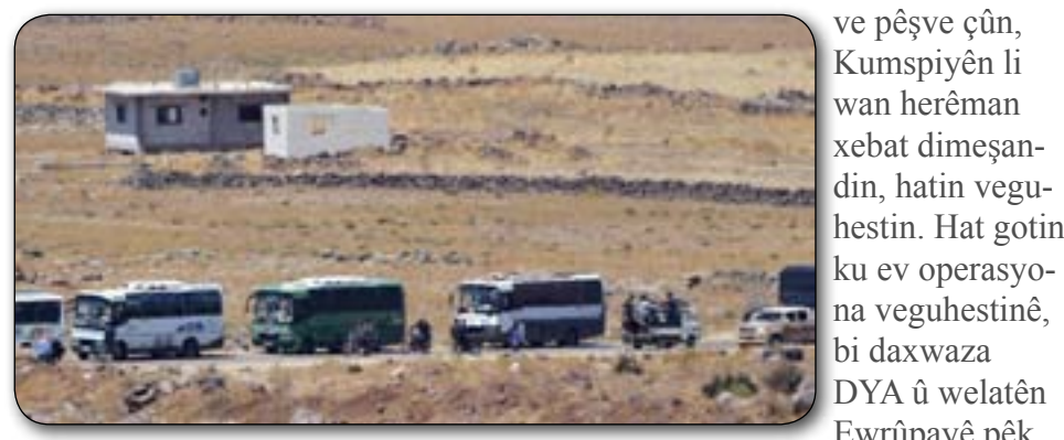
Artêşa İsraîlê, 800 endamên rêxistina "alîkariyê" ya bi navê 'Kumspî' ku li Sûriyeyê li herêmen di bin serweriya komên çekdar de dixebitin, li gel malbatên wan veguhestin Urdunê. Li gorî artêşa İsraîlê, piştî ku hêzên rejîma Sûriyê ber bi başûrê welêt

ya derxistina kesên di bin kaviil û xirbeyan de mayî dihatin nasîn." Kumspîyên ku li qadên di bin serweriya komên çekdar û komên sîcên giran ên şer dikin de xebat dimêşin, li gorî artêşa İsraîlê di bin gefa ku ji hêla rejîmê ve bîna kuştin û girtin de ne. Li ser mijarê artêşa İsraîlê got, "Ev nêzikatiyêke awarte ya mirovî ye. İsraîl, hê jî xwedî wê politîkayê ye ku tevli şerê li Sûriyê nebe û berpîrsarê vî şerê ku li ser xaka Sûriyê pêk tê, rejîma Sûriyê bi xwe ye." Kumspî, gelek caran bi hevkarîya komên çete hate sîccdarkirin. He-man kes dişa bi sîccdariya ku dest-werdana hêzên Ewropayî ya li ser xaka Sûriyê rewşa nişan bidin û vî amade bikin, îstîtokên weke "êrişa çekên kîmyewî hat kirin" hatin sîccdarkirin.