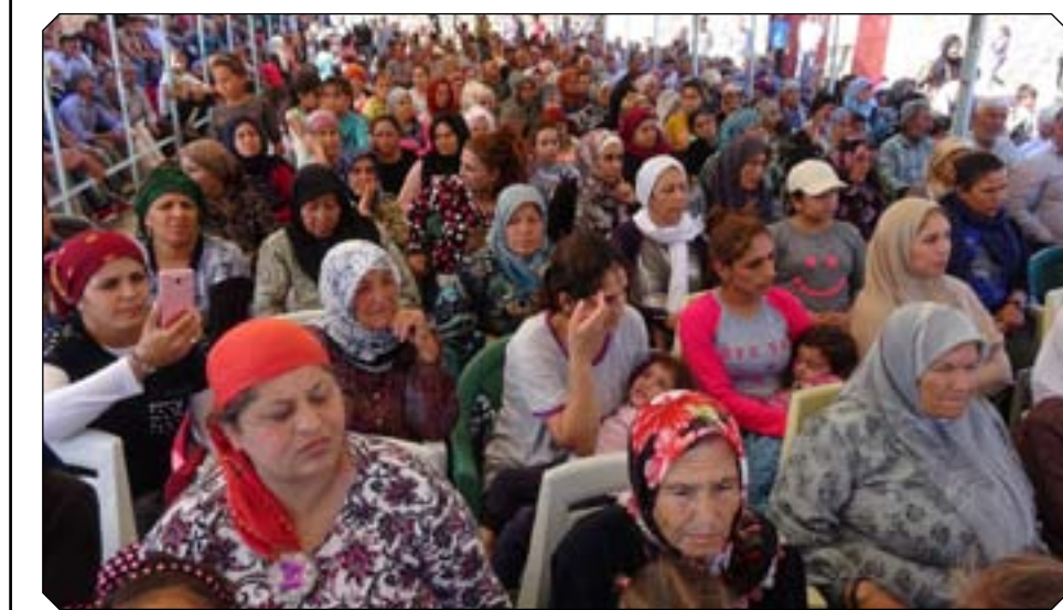
Endamên Konferansa Rizgarkirina Efrînê di 2 civinên cuda de diyar kirin ku armanca wan rizgarkirina Efrînê ye.