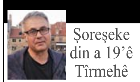
Şoreşeke din a 19'ê Tîrmehê

dikin. Ne xema wan e bê zarok e ya jî extiyar e. Êşkenceyê li hemûyan dikin. Zêdeyî 20 kes li taxa me girtin. Hevalê min girtin. Hevsêra wî mamostê bû. Hevsêra wî reviya, lê hevalê min di destê wan de ye. Gelek çete ketibûn nava gundê me. Min nêma dikarî îfade bikim. Mi got, "çi dibe bila bibe, em bimirim jî ez ê derkevim." JÎ BO HILBIJARTINÊ NASNAME ÇÊKIRIN M.Q. anî zanim ku dewleta Tirk û çeteyên wê dest danînin ser erd û zeviyan gel û bi kirê didn xwediye wan. M.Q. got, "Dewleta Tirk jî gelê li wir re got, 'em ê nasnameyê bidin we, hem jî bo li nava Efrînê bi rehetî bigerin, hem jî li welatên din'. Ji hemû mirovên li wir re