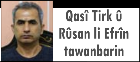
Qasî Tirk û Rûsan li Efrîn tawanbarin

Temellî, di dewama axaftina xwe de wiha got: "Desthildarî ji