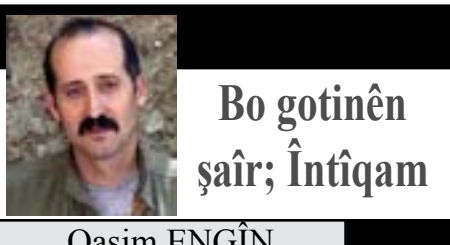
Bo gotinên şair; İntîqam