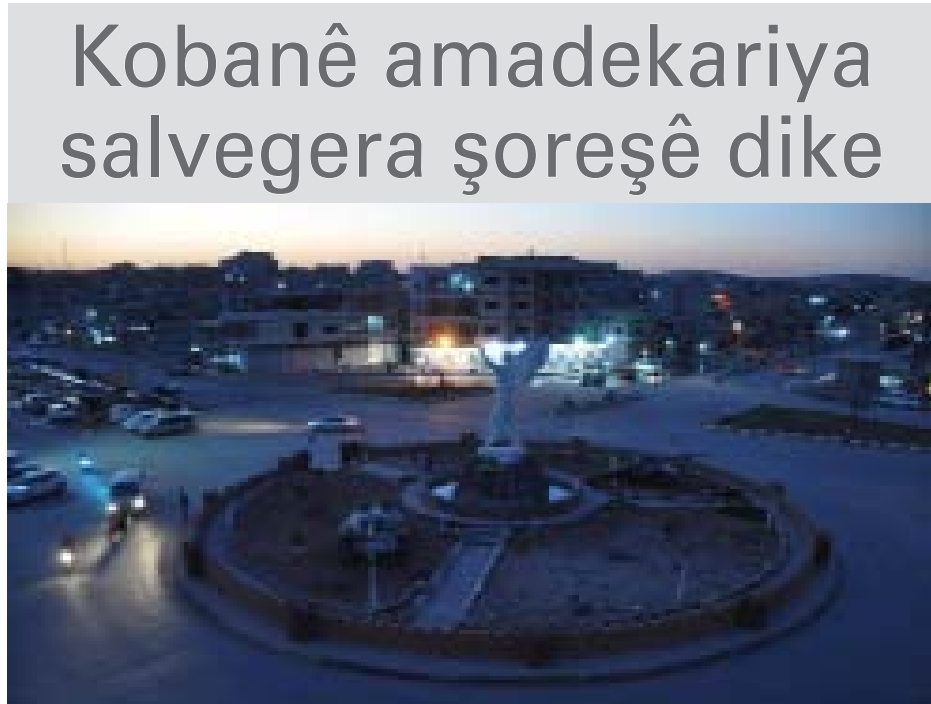
Li Kobanê amadekariyên pêşwazîkirina salvegera 6'ê min a Şoreşa 19'ê Tirmehê dest pê kirin. Çirûska Şoreşa Rojava, 19'ê Tirmeha 2012'an de ji Kobanê dest pê kir û li tevahî Rojava