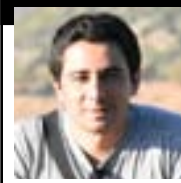
Ti xêr ji wan nayê