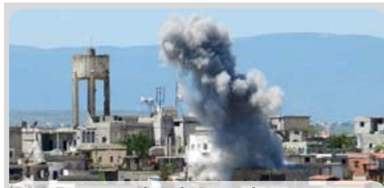
Li Deraayê bêdengî serwer e

polîtîkayên mêtînger qirker bûn wijdan, exlaq, hesret û temsîla Kurdan. Eger ew wê wextê li ber mêtîngeriya qirker ranebûna, ew berdêl nedabûna, wê têkoşîna azadî û demokrasîyê derneketibûna holê. Kêmasiyên xwe yên rêxistinî û rêbertî çî dibê bila bibe, ji aliyê diroki ve xwedî rozeke bi vî rengî ya mezin bûn. Hezar carî heq kirine ku bibin pêşiyên bi rûmet ên Kurdan. Şêx Seîd, Îhsan Nûrî Paşa û Pîr Seyîd Rîza, weke pêşiyên bi rûmet ên Kurdan nişan dan ku divê helwesta Kurdan çawa be. Gelê Kurd gelekî deyndarê wan e. Zarokên wan ji wê bibin xwedî sekna wan a bi rûmet û xewn û xeyalên wan teqez pêk bînin. 'ŞEHÎD ZILAN DI DEMÊN ZEHMET DE BÛYE RÊBEREK' Hevrê Şehîd Zeynep Kinaci ji nişan da ku di dema herî zehmet de divê helwesteke çawa be nişandan û mîna berxwedêrên 14'ê Tîrmehê, rêbaza şoreşa Kurdîstanê raxist pêş çavên gel û hevreyên xwe. Lewma divê Şehîd Zilan weke rêbera