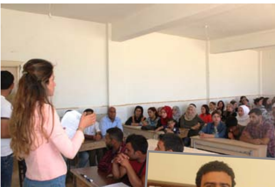
Armanç ji perwerdeya mamosteyan, perwerde kirina li ser materyalên nû û rê û rêbazê perwerde dayîni ye.

Komîteya Perwerdeya Civaka Demokratîk ji bo asta mamosteyan pêş bikeve dest bi perwerdekirina mamosteyan kir. Komîteya Perwerdeya Civaka Demokratîk a herêma Fîratê xebatên perwerdekirina mamosteyên seratayî, navîn û amedehiî da destpêkirin. Perwerdekirina mamosteyan piştî sala xwendinê ya 2017-2018'an bi dawî bû da destpêkirin. Di perwerdeya ku di peymangehan de tê kirin, mamoste li ser rêbazên fêrîkirinê tene perwerdekirin. Xebatên perwerdeyê duh dest pê kir û wê 70 rojan dawam bike. Di perwerdeyê de wê herî zêde li ser rêbaza mamosteyan were sekinandin. Çar hezar û 676 mamosteyên jî herêma Fîratê tene perwerdekirin, ji wan 2 hezar û 616 mamoste ji Kobanê ne û 600 jî bajaroka Eyn Îsa ne. Li Eyn Îsa 25 mamoste li ser xebatên perwerdekirina mamosteyan disekin. Sedema vekirina dewreya mamosteyan ew e ku sistem û materyalên nû ji mamosteyan re werin zelal kirin. Di perwerde-neyênî dike. Rojgar balkişand ser çekên bê ruxset jî û got, "pêwîste bikaranîna çekên bê ruxset were şîndar kirin..." ROJNEWS