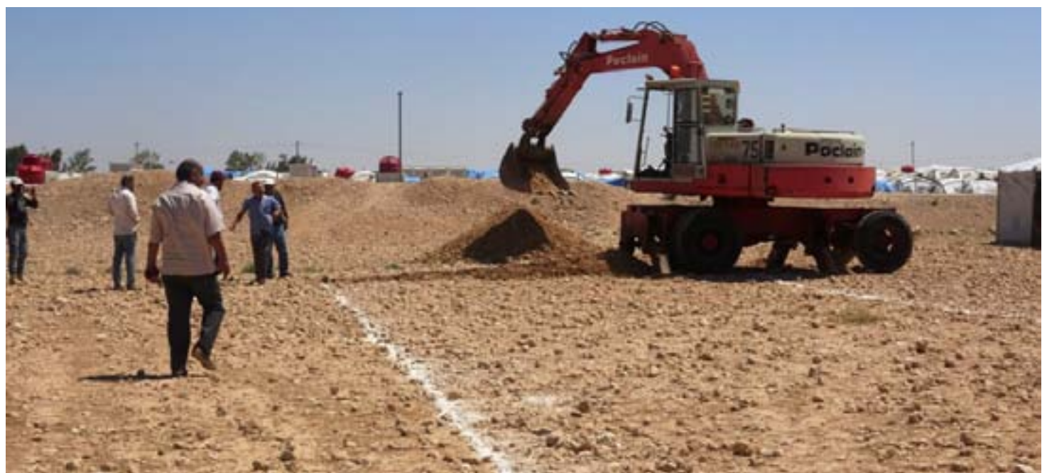
kir ku xebatên depoyê dê mehekê dirêj bike.

Şaredariya Gel a Eyn Îsa dest bi kolana depoya ava kanalîzyasyonê kir. Bi vê yekê jî dê ziyarîna li ser xweza û şênîyan kêmbibin. Li ser giliyên şênîyên navçeya Eyn Îsa ya herêma Fîratê ya Bakurê Sûriyê, Şaredariya Gel a navçeyê û bi hevkarîya rêveberîya kampê dest bi kolandina depoyên bînerd ji bo ava kanalîzyonê kir. Depo li nêzî kampa navçeyê tê amadekirin. Armanç jî vê yekê jî ew e ku ava kom dibe, zirarê dike û dibe sedema nexweşîyan û belavbûna bêhna nexweş ji holê rabe. Depo bi dirêjahiya 25 û firehiya 5 metreyan û kûrbûna 3 metre-yan hate çêkirin. Rayedarên şaredariyê destnîşan