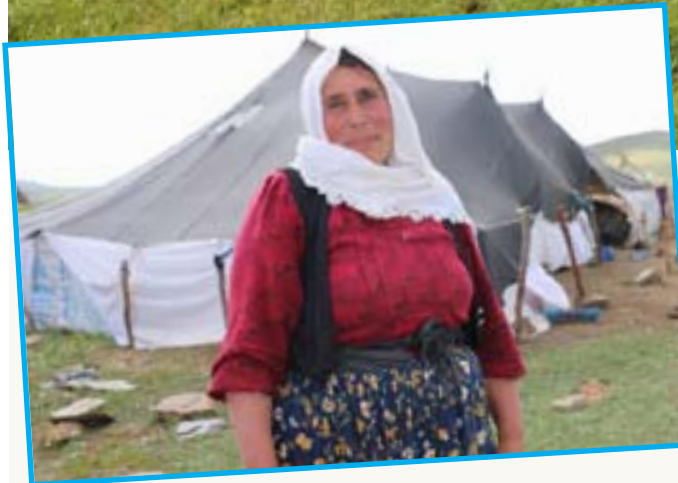
wisa dewam bike ew ê ji mecbûrî dev ji sewalvaniyê berdîn. Her wiha koçeran bilêv kir ku zozanên

Koçerên Sêrtî ku her sal berê xwe didin zozanê Nebirnavê, destnîşan kirin ku ji ber qedexekirina zozanan her diçe heqê kirêya mîrgan zêdetir dibe. Koçeran got, “eger wisa dewam bike ew ê ji mecbûrî dev ji koçertiyê û sewalvaniyê berdîn.” Koçerên Sêrtî, îsal jî berê xwe dan zozanê Nebirnavê ku di navbera Colemêrg-Wanê de ye. Koçeran bal kişand ser qedexekirina zozanan û destnîşan kirin ku eger