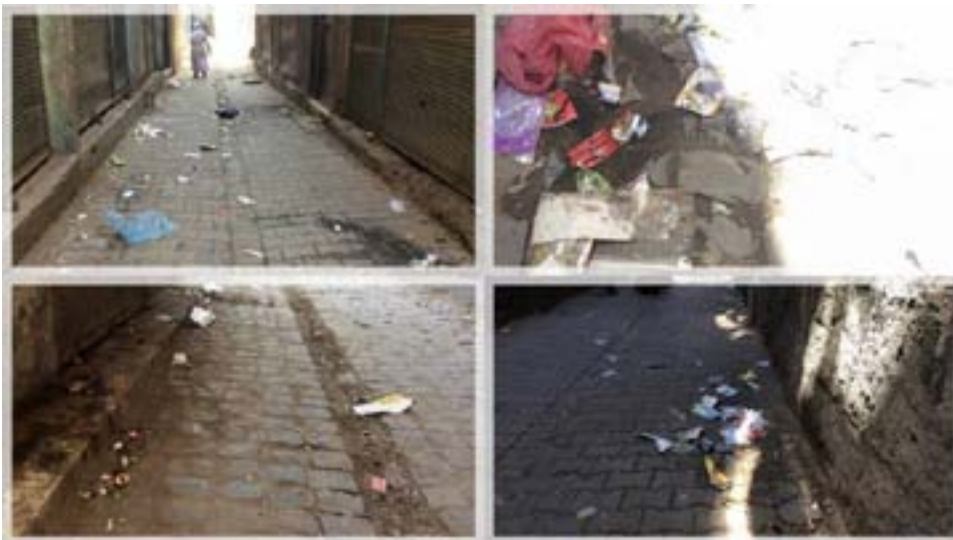
bi gelaşê tijî bûne niştecihên li navçeyê bertek nişanî qeyûm dan û wiha gotin: "Dibêjin paqijî ji îmanê ye û hikûmet bahsa îmanê dike. Lê jî gelaşê li kolanên me diyar e ku hikûmet tişteki jî îmanê fam dike. Ji ber gelaşê em nema diwêrin di

Şaredariya Sûrê ya ku qeyûm tayînî wê hatiye kirin, ev 2 meh in kolanên sûrê paqij nake û jî gelaşê re hiştine. Niştecihên Sûrê bertek nişanî ve helwesta qeyûm dan û gotin: "Dixwaze kîjan bedelê bime bide dayîn?" Piştî ku li Tirkîyê rewşa awarte hat îlankirin û şûnde şaredariyên Partiya Herêmên Demokratîk (DBP) jî wezîfê hatin girtin û li şûna şaredarên DBP'ê qeyûm hatin tayînkirin. Ji van şaredariyan ku qeyûm tayînî wan hatin kirin yek jê jî Şaredariya Sûra Amedê ye. Qeyûmê ku di serî de saziyên jinan jî hatin xwekirin, niha jî kolanên ditroki yê Sûrê jî gelaşê re hiştine. Welatiyên Sûrê ku jî ber gelaşê li kolanan nema dikarin tevbigerin bertek nişanî qeyûm dan. Li Sûra ku hemû kolanên wê