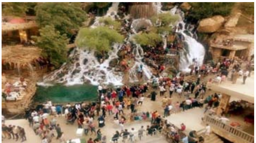
Kurdistanê berê xwe dane herêma geştiyariyê yê Başûrê Kurdistanê... ROJNEWS

Buroya Karkirinê ya girêdayî Komîteya Karûbarên Civakî ya Meclîsa Sivîl a Demokratîk a Reqayê bi armanca peydakirina kar jî welatîyên Reqayê re û bi taybet ji ciwanan re li gorî bawername û pisporiyên wan bi hemû hêz û derfetên xwe dixebite û pêşwaziya daxwaznameyên welatîyên dike. Heta niha hejmara daxwaznameyên ji Buroya Karkirinê re hatine 6 hezar in. Buroya Karkirinê li gorî bawername û pisporiyên welatîyan li gorî derfetên xwe mehanê jî 350 heta