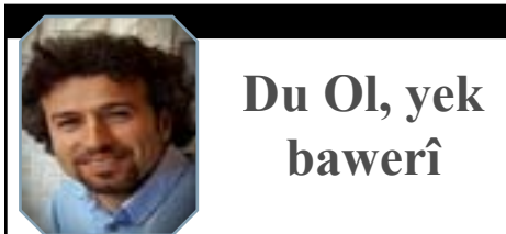
Du Ol, yek bawerî

Daxistan li çiyayan di nav xebatên TEV-ÇAND'ê de cih digire. Bi qasî xebatên pratîkî yên gerila di nav xebatên çand û hunerê de jî nûjenî û dîsîplînê esas digire. Daxistan li hemberî ferasetên ku dixwestin xebatên çand û hunerê ji rê derxin û dejenere bikin bi sekna xwe ya rêxistinî û bi xebatên xwe yên pratîk bersiv dida. Daxistan di xebatên xwe de her tim bi nûjeniyê dixwest bibe bersiv û jî aliye di nav ve jî texrîbatên ku hêzên serwer li ser gelê kurd çêdikir dikir mijar. Daxistan, bi qasî xebatên komî, di xebatên tekekesî de jî dema derdiket ser dikê temaşeker di bîra listika xwe de diherî. Dizanibû peyama xwe bi awayekî herî bi bandor bide. Tu carî hevalên xwe yên gerîla yên di nav xebatên çand û hunerê de kar kiribûn ji bir nedikir. Li ser dikê bi listikên xwe ew