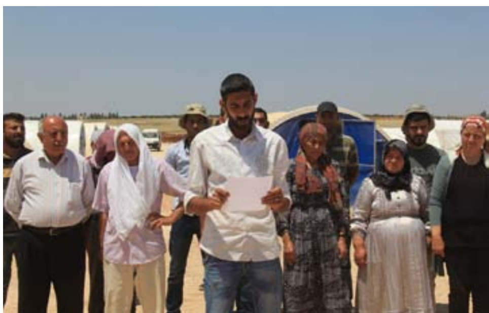
welatiyên Êzidî xwarin. Van komên çete êşkere radigihanandin ku tişt a li Şengalê dest pê kirine de li Efrînê berdewam bikin. Çeteyan hemû mezar û deverên pîroz ên Êzidiyan

Mayîna ola Êzidî tê wetaya berdewama berxwedana li dijî dagirkeriyê. Ola Êzidî weke her tim bû hedefa dijminên gelê Kurd. Ji destpêka aloziya Sûriyê ya sala 2011'an ve û piştî valahiya rêveberî ya li herêmenê Kurdî, Rêveberiya Xweseriya Demokratîk hate damezrandin ku cara yekemîn hebûna Êzidiyan û ola Êzidî nas dike. Welatiyên Êzidî bi vê yekê dest bi damezrandina komeleyên xwe yên Êzidî kirin û bi armanca perwerdekirina zarok û ciwanên xwe li ser bingehên rê û resmên ola Êzidî li gelek gundan dibistanên xwe vekirin. Bi destpêkirina êrişa artêşa Tirk a dagirker li dijî herêma Efrînê komên çete yên girêdayî wê gefên kuştin û serjêkirinê li