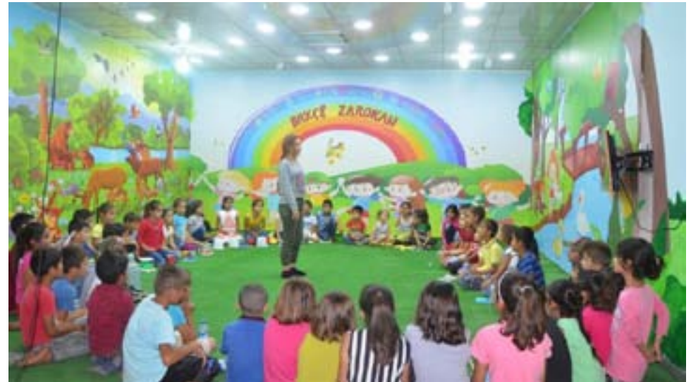
man ji anî ziman ku zarok siberoj e divê mirov li siberoja xwe xwedî zarokên jî mîhrîcanê zarokan bibin... JINNEWS

ji hev feyzê bigirin. "ZAROKÊN AFRÎNER Sîdarê di berdewamiya axaftina xwede bal kişand ser delalî û zîrekîya zarokan û wiha pê de çû: "Tevî zor û zehmetiyên ku penaber dibînin ji dîsa zarok xwedî taybetmendiyek hunerî û afirîner in. Ji bo dîtina behemên zarokên penaber em hevî dikin ku zarokên ji her parçeyê Kurdistanê tevli mîhrîcanê bibin. Ji bo vê mîhrîcanê ji zarok bi keleşanî û coşê mezin tevli xebatên amadekariyê dibin." Her wiha mamoste Medya Ye-