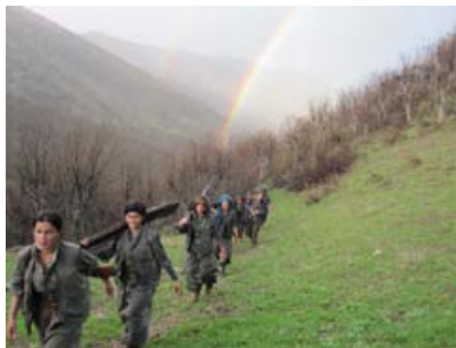
Gerilayên HPG'ê li Şemzînan, Çelê, Kerboran, Barzan û Semsûr li dijî leşkerên Tirk çalakiyên xurt lidar xistin. Di van çalakiyan de herî kêr 6 leşker hatin kuştin. Navenda Ragihandin û Çapemeniyê ya HPG'ê diyar kir ku di çarçoveya 'Pêngavên

Şoreşgerî ya Şehîd Pîroz û Şehîd Agirî' de li Colemêrg û Başûrê Kurdistanê çalakî kirine. Di çalakiyên 6-7'ê Hezîranê ya li sê nuqteyên cuda de, 6 leşker hatine kuştin. Agahiyên teklîdarî çalakiyên li Colemêrg û Barzan wiha ne: "Hêzên Me di çarçoveya Pêngava