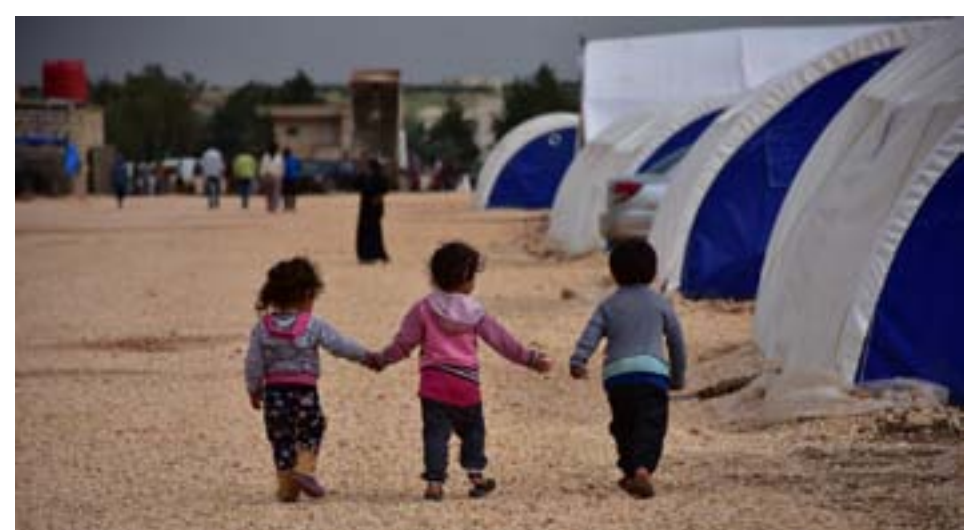
Heyva Sor a Kurd ji noqteyê xwe li kampê ava kir û xizmeta tenduristiye pêşkêşî gel dike. Şênîyên ku li kampê dijîn ban-