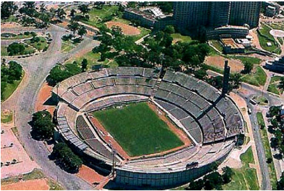
ملعب أوروغواي يتحول إلى ملجأ بسبب كورونا

ويعاني أولئك الذين تم استيعابهم في هذا المكان، وجميعهم رجال، من نقص المناعة بسبب الأمراض المزمنة مثل السكري وفيروس نقص المناعة البشرية (إتش آي في) أو الانسداد الرئوي المزمن.