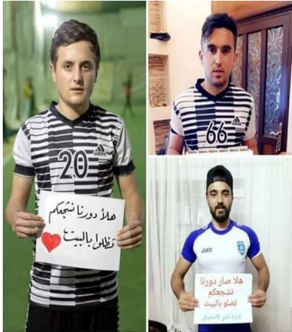
حملة خليك بالبيت

وبشكل أولي، سيظل الأشخاص ٢٨٨ في المبنى طوال فترة الطوارئ الصحية التي تواجهها الدولة الواقعة في أمريكا الجنوبية منذ ١٣ آذار وسيتلقون أربع وجبات يومياً.