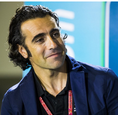
محرر الصفحة - جوان محمد