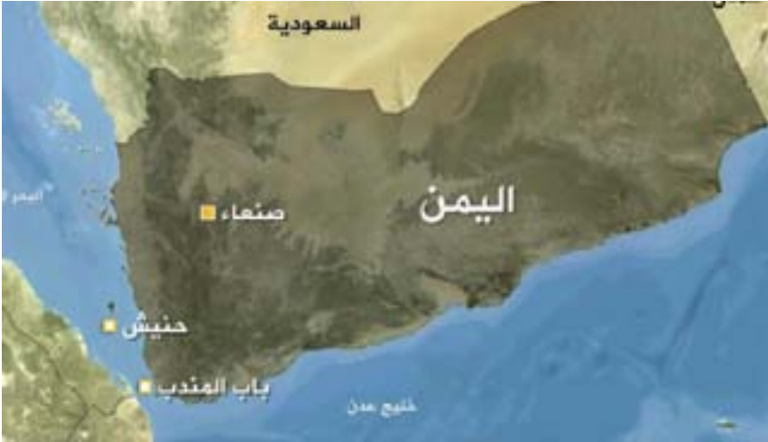
خريطة اليمن مع صنعاء و حنيش و باب المندب

ويبين بأنه موازاة هذا الدعم العسكري والمالي والإعلامي توصل تركيا انتشارها في المناطق الواقعة تحت سيطرة جماعة الإصلاح من خلال هيئة الإغاثة التركية، إذ إن الدعم الإنساني أصبح ستاراً للتدخل التركي عبر عاونين إقامة مستشفيات ومدارس وتقديم المعونات الغذائية، ولكن في حقيقة الأمر، تحول هذا النشاط إلى جهد استخباراتي بامتياز، ولعل النشاط الاستخباراتي التركي السابق في العراق وسوريا وليبيا والصومال وغيرها من المناطق، يؤكد هذه الحقيقة، وطبيعة المتاجرة بالشعارات الإنسانية والأخلاقية لصالح أجندة توسعية لها علاقة بالسيطرة والهيمنة من خلال إنشاء جماعات عسكرية تابعة لها، وتمكين هذه الجماعات من السيطرة وامتلاك عناصر القوة، تطلعا