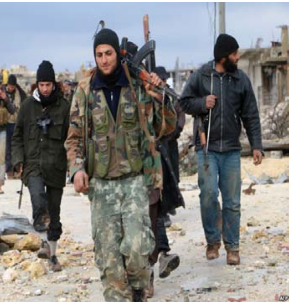
تصفيتها في منطقة إدلب.

فتردد في أوساط المحللين السياسيين، أن رجب طيب أردوغان احتل ربع مساحة سوريا، بمقايضة مع روسيا، سلم فيها ثلث مساحة سوريا إلى بشرّ الأسد بدون أن تطلق السلطة والمعارضة طرفة واحدة، وهي الآن تحاول تسليم إدلب مقابل التغيير الديمغرافي في «شرق الفرات». ففي مؤتمر أستانا-١٤ جمع، أن المعارضة السورية المسلحة بكل فصائلها وجهت لقتال الكرد، أما الذين لم يتزكرو الجبهة مع السلطة فرزوا كمنظمات إرهابية اتفق الجميع على إزالتها، وسيتم