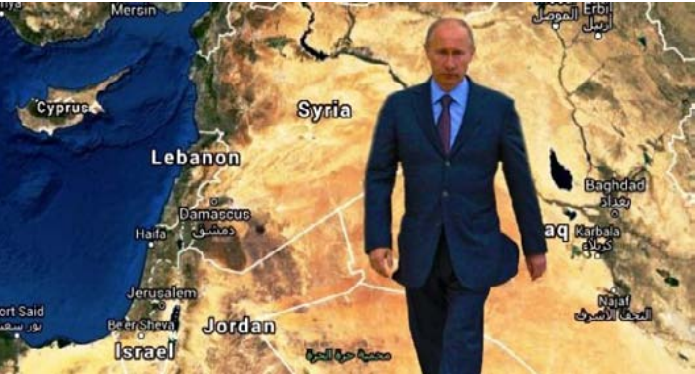
خارطة الانتشار كان الامتداد ما بين المحيط

الأطلسيّ وحتى البحر الأسود، فاستشعرت الخطر وازدادت أن تبعث برسالة مضمونها الرقاة للتحالف، وأن سياستها مبنية على أساس عدم التخلّي عن حلفائها والدفاع عنهم سياسياً وعسكرياً وأياً كانت التكلفة، وأنّ أيّ حراك مناهض لحلفائها مصيره الفشل. تعتقد موسكو أنّ الحرب السوريّة تُدوّر بين الأطلسيين والأرايين، بين ممثلي النظام العالميّ أحاديّ القطب الذي تقوده واشنطن وآخر متعدد الأقطاب تقوده موسكو. القوقاز داخل الاتحاد الروسيّ نفسه. ولهذا الموقع الجغرافيّ، كونه محلياً اجتماعياً وثقافياً، أما الجغرافيا السياسيّة فتنتظي على طابع المجتمع، فتأخذ بالاعتبار «المشهد المحيط».