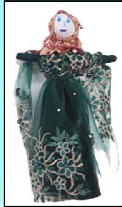
Bexçeya Arî li taxa Cûdî