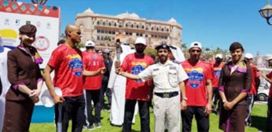
لاعبات المنتخب الوطني لكرة اليد.

تصل «شعلة الأمل» إلى مطار أبوظبي الدولي، قادمة من أثينا مع اقتراب العد التنازلي للأولمبياد الخاص، الألعاب العالمية بأبوظبي ٢٠١٩.