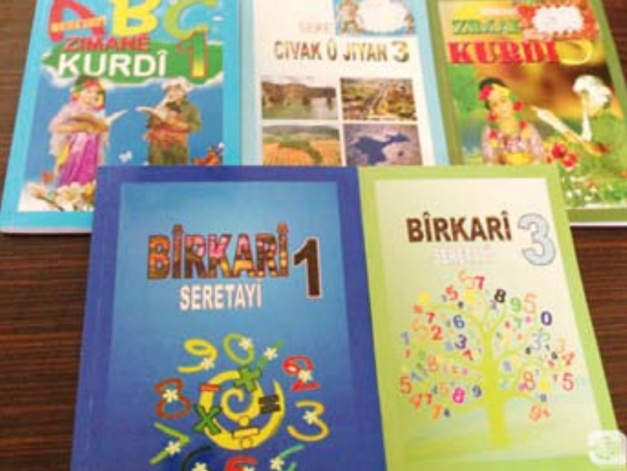
كتب اللغة الكردية للأطفال في الحسكة.

روناهي/ الحسكة – لا يمكن القضاء على أمة دون القضاء على لغتها، وهذا شأن اللغة الكردية التي حاول أعداء الشعب الكردي القضاء عليها وإزابتها ليتمكوا من فك رابطة اللغة بين الكرد، ولكن الشعب الكردي استطاع الحفاظ على لغته القومية على مدى قرون، هذا ما أكدته مُدرّسات اللغة الكردية بالحسكة.