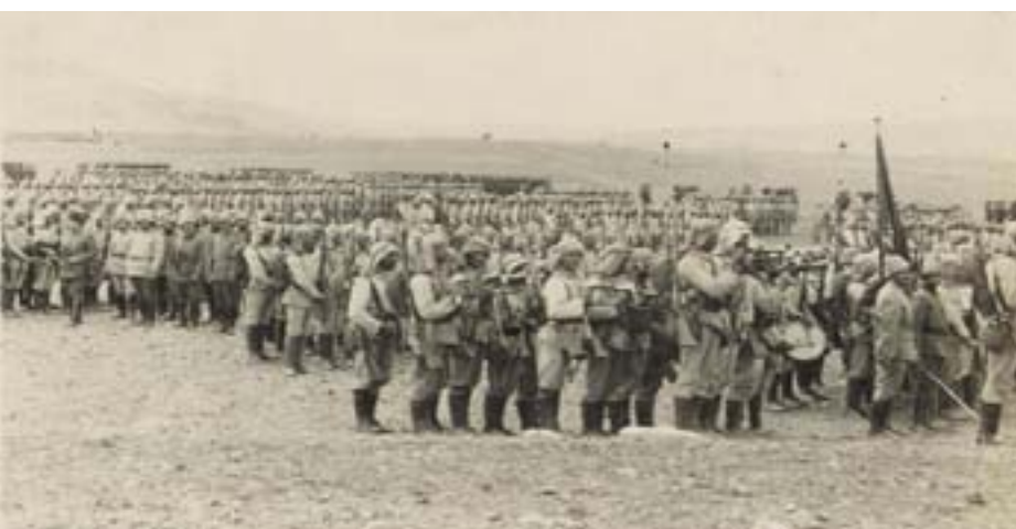
جيش العثماني بقيادة إبراهيم باشا، وسط الجزيرة العربية، أسبعا محمد بن سعود آل سعود، الذي اتخذها عاصمة لدولته، استمرت الثورة السعودية الأولى في التوسع حتى سقوطها عام ١٨١٨ على يد الجيش العثماني بقيادة إبراهيم باشا.

وارتكب حسين بك الذي ناب عنه فطائع فيها بعد أن أحرق بعض الأهالي وذبح بعضهم ونفى البيض الآخر، وجاء في بعض الوثائق في السفارة الروسية بالأستانة: «في الأسبوع الماضي قُطعت رؤوس زعيم الوهابيين ووزيره وإمامه الذين أسروا في التركية السعودية، رغم أن الحرب عليها بدأت منذ